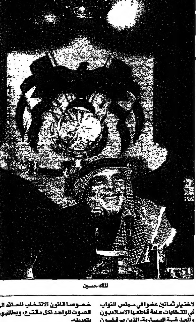
عمان - القدس العربي

كاد العامل الاردني الملك حسين امس الثلاثاء ان يقرر ان قانون الانتخاب الذي ترفضه المعارضة الاسلامية واليسارية سيتم تعديله ليعالج بعض الامور التي ظهرت خلال عملية الاقتراع.